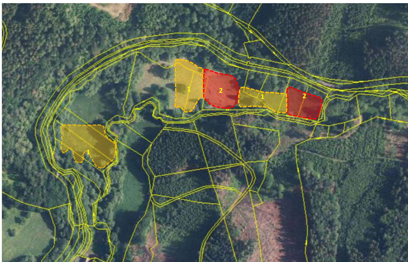
Obr. 1 Schematické znázornění ploch určených ke kosení (jednotlivé etapy)

Kosení je nutné provádět důsledně až do krajů okolních dřevinných porostů a k břehové hraně Bystřice . Na předmětných plochách jsou vlhké pcháčkové louky bez vhodného přístupu techniky, a proto bude veškerá pokosená biomasa po důkladném vyhrabání spálena na místě . V zájmových plochách bude zřízeno maximálně 6 ohnišť, která budou umístěna mimo výskyt upolínu nejvyššího a prstnatce májového (viz obr. 2). Po skončení pálení bude popel rozprostřen do okolí ohniště v tenké vrstvě.