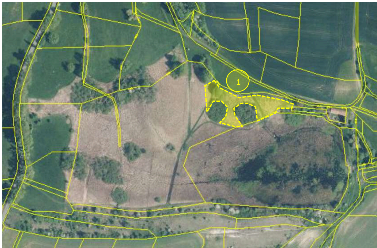
Obr. 3 Schematické znázornění zájmové plochy určené ke kosení travních porostů včetně odstranění výmladků dřevin, vyhrabání a odvoz biomasy na části pozemku p. č. 827 v k. ú. Ostružno u Jičína (žlutě)