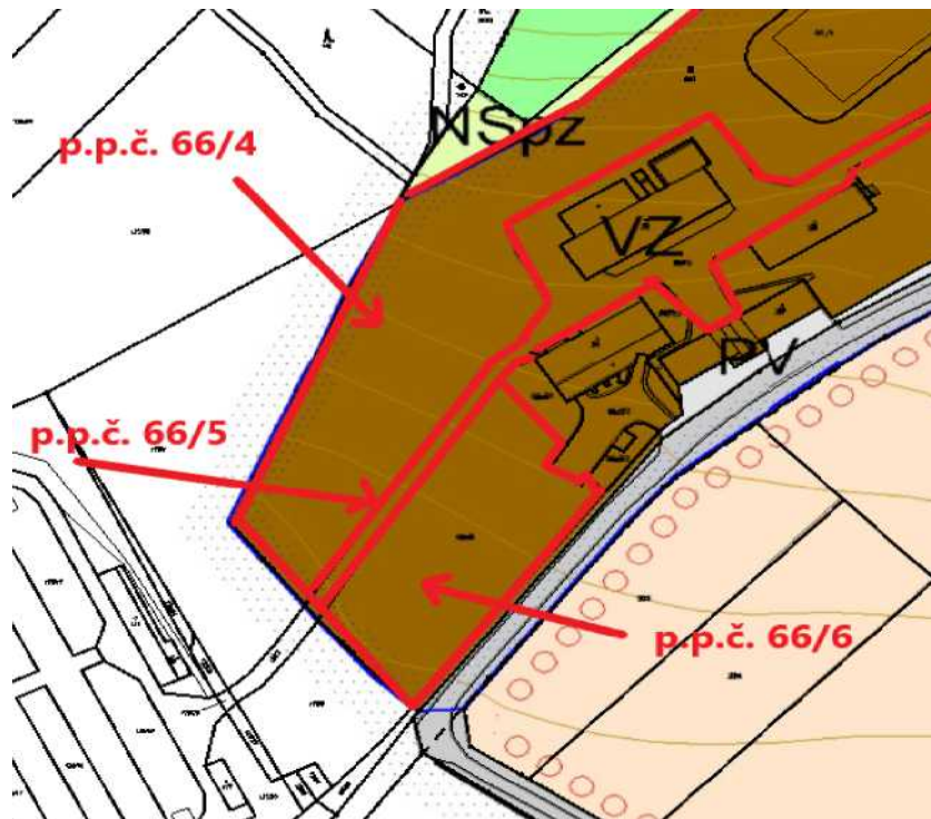
obr. č. 2 – výřez z Územního plánu Radim z Hlavního výkresu zobrazující pozemky, na kterých je záměr navrhován v k. ú. Lháň. Z textové části Územního plánu Radim vyplývají následující podmínky funkčního využití plochy „Plochy výroby a skladování – zemědělská výroba - VZ“: