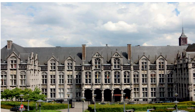
Palais provincial á Liège