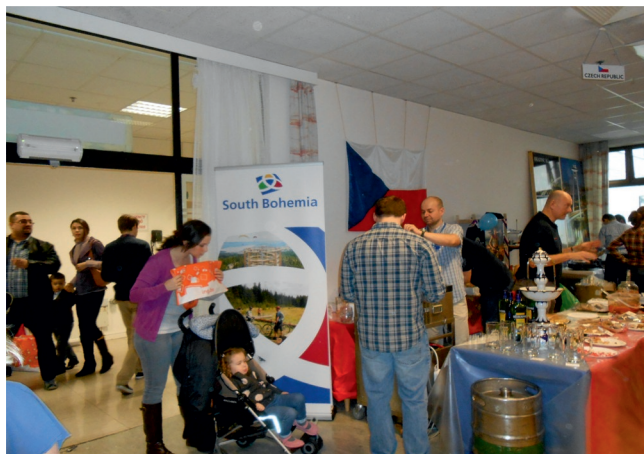
Stánek s českým občerstvením