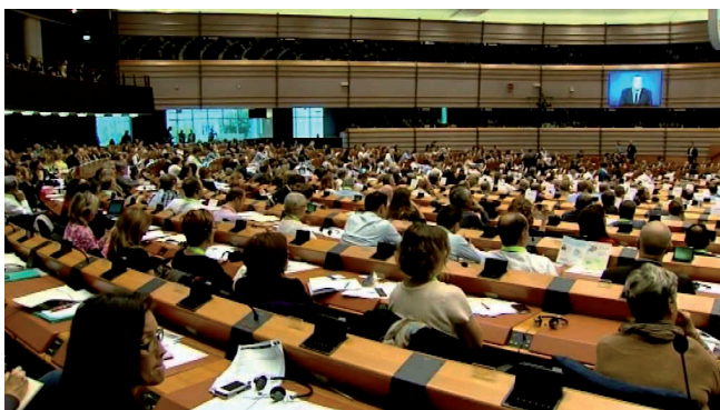
Slavnostní zahájení Open Days v Evrop. parlamentu