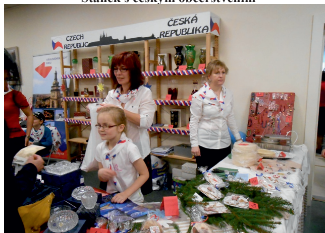
Stánek s českými produkty

reklamu a náklady na dopravu a dopravní prostředky. Žadatelé může být přiznáno maximálně 10 000 eur. Žádost musí být zaslána na adresu charity@natocharitybazaar.org do 1. května kalendářního roku.