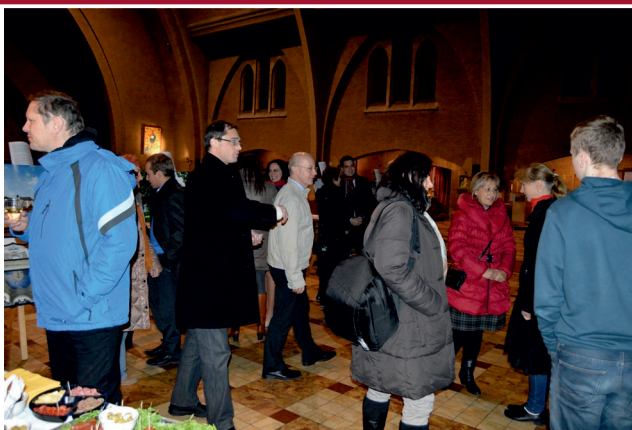
Slavnostní zahájení výstavy