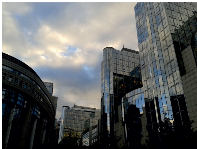
Budovy Evropského parlamentu v Bruselu

Soutěže o plně hrazený studijní pobyt do Evropského parlamentu v Bruselu na tři dny se mohou zúčastnit studenti učilišť, středních škol, vyšších gymnázií a vysokých škol z Jihočeského a Královéhradeckého kraje. Jihočeští studenti budou psát slohové práce na vybraná témata. Královéhradečtí studenti budou pořizovat fotografie z Královéhradeckého kraje s tematikou Evropské unie. Odborná porota vybere nejlepší fotografie, které mezi sebou budou soutěžit na facebookových stránkách. Tři nejlepší slohové práce budou vyhodnoceny odbornou porotou. Více informací k oběma soutěžím naleznete na straně 9 nebo na webových stránkách www.krajeveu.cz .