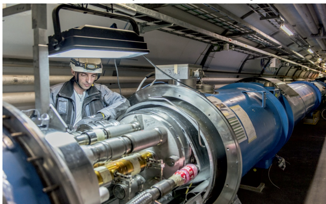
Část urychlovače částic

slavila zejména prokázáním existence „božské částice“ - Higgsova bosonu. Její založení se datuje k roku 1954 a Česká republika se podílí na její činnosti od svého vzniku v roce 1993. Cílem této organizace je spolupráce evropských států v oblasti čistě vědeckého a elementárního výzkumu a s nimi souvisejících oblastech, nezabývá se činností pro vojenské účely, výsledky jejích experimentálních a teoretických prací se zveřejňují nebo jinak zpřístupňují veřejnosti.