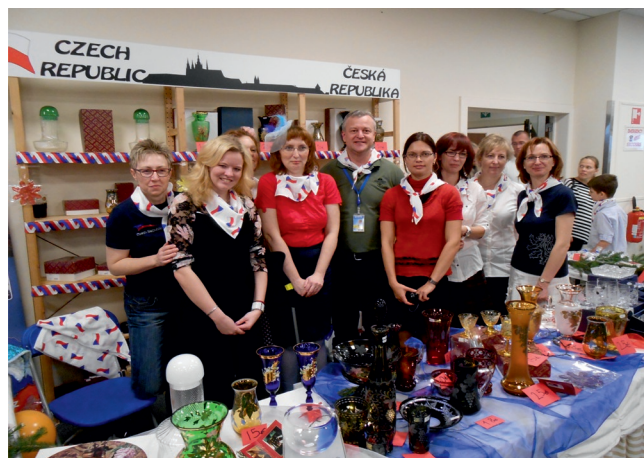
generálmajor Miroslav Žižka v českém stánku

O příspěvek mohou požádat neziskové organizace mající alespoň rok platnou registraci. Do seznamu žadatelů mohou být zařazeny i nezávislé organizace s maximální výší příjmů 250 000 eur za rok a s maximálním vlastním kapitálem ve výši 1 milion eur. Organizace musí mít sídlo v některé z členských nebo partnerských zemí NATO. Předložené projekty jsou posuzovány z hlediska dlouhodobého přínosu pro co největší počet potřebných lidí. Jsou rozděleny do těchto oblastí: životní prostředí, zdraví a vzdělávání a jsou určeny na pomoc dětem, ohroženým ženám, seniorům a handicapovaným lidem. Finanční prostředky se však nesmí vztahovat na provozní náklady organizace, na platy zaměstnanců, výdaje na