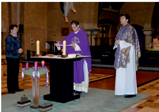
Česká mše v Bruselu

ního panství postaveny podle plánů nejlepších architektů své doby - Kryštofa Dientzenhofera (mj. kostel sv. Mikuláše na Malostranském náměstí v Praze) a jeho syna Kiliána Ignáce v poměrně krátkém časovém rozmezí mezi léty 1709 – 1743.