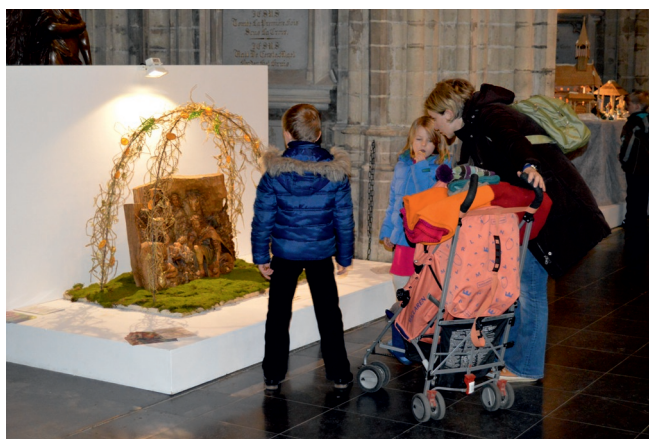
Návštěvníci u českého betlémů

„Pro letošní výstavu v Cathédrale des Saints Michel et Gudule zapůjčilo Třebechovické muzeum Betlémů ze svého bohatého sbírkového fondu reliéf Narození Páně. Autorem řezby je známý český sochař a řezbář