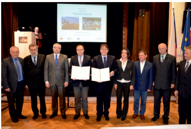
Pracovní skupina ESÚS Novum

( www.evropskyregion.cz ) – nejedná se sice přímo o ESÚS, ale rozsah aktivit tohoto pracovního společenství sedmi partnerských regionů (Jihočeského kraje, Plzeňského kraje, Kraje Vysočina, Horního Rakouska, dolnorakouského Mostviertelu a Waldviertelu, Dolního Bavorska s Altöttingem a Horní Falce) je obdivuhodný a inspirující.