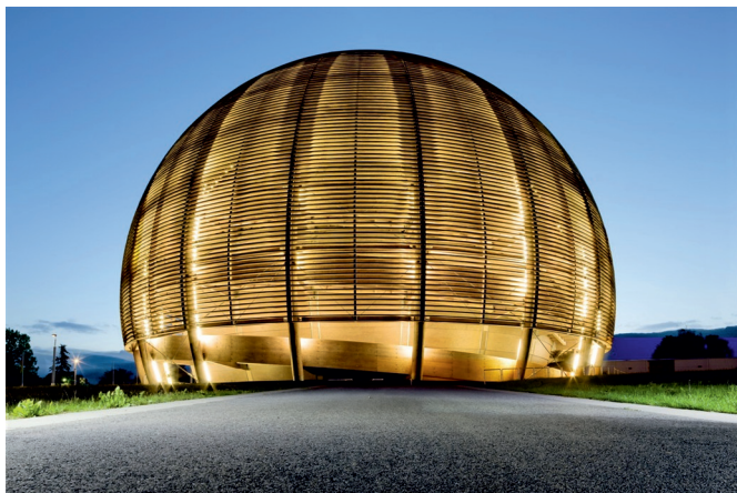
Budova stálé expozice CERN

CERN je Evropskou organizací pro jaderný výzkum se sídlem v Ženevě, která se v posledních letech pro-