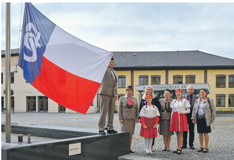
Sokolové na Pivovarském náměstí před krajským sídlem v rámci Památného dne sokolstva připomněli tragické události, které se odehrály v noci ze 7. na 8. října 1941. Gestapo tehdy provedlo „Akci Sokol“, během níž pozatýkalo na 1 500 sokolských činovníků z ústředí, žup i větších jednot.