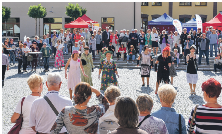
Folklór, country, dechovka, prvorepubliková móda a samozřejmě bohatý doprovodný program, to byl Svátek seniorů v Hradci Králové. Pivovarské náměstí první říjnový den zaplnily stovky seniorů, kteří si přišli užít společné odpoledne plné hudby, tance, tipů na výlety nebo ukázkę práce zdravotníků a pečovateli.