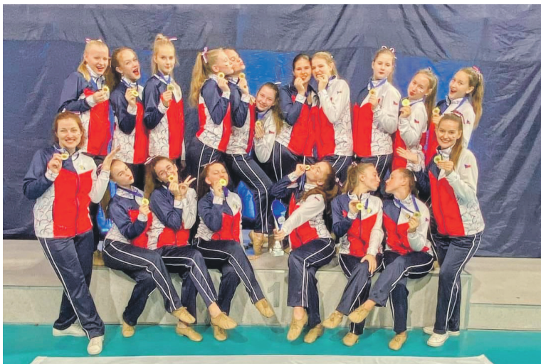
Zlatá děvčata z Liverpoolu vezou domů další medaile! Mažoretky Střípky Olešnice v říjnu zvítězily v kategorii Traditional Pompons Corps na mistrovství Evropy v Bulharsku!