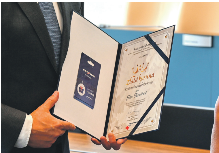
V sídle kraje převzalo ocenění za dlouhodobou práci s dětmi a mládeží patnáct dobrovolníků, kteří ve svém volném čase pomáhají rozvíjet zájmy dětí, jejich dovednosti, hodnoty a předávají jim své zkušenosti z různých oblastí. Seznam oceněných najdete na webu kraje www.khk.cz .