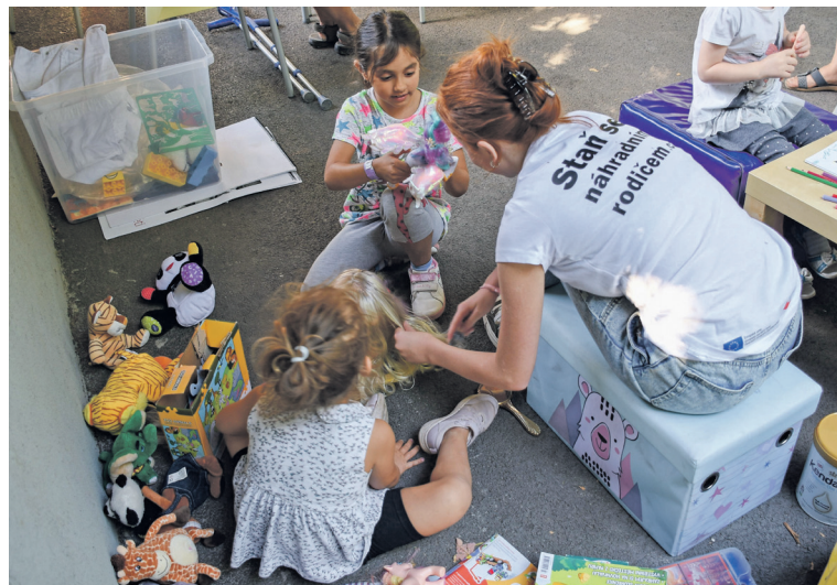
Dnem pro pěstouny vyvrcholil na konci září Týden pěstounství Královéhradeckého kraje. Ve více jak 10 městech regionu se uskutečnila řada akcí, které přiblížily veřejnosti téma náhradní rodinné péče. Na Dni pro pěstouny v Safari Parku Dvůr Králové se sešlo více jak 130 pěstounských rodin, aby si užily nejen krásy safari parku, ale také doprovodný program.