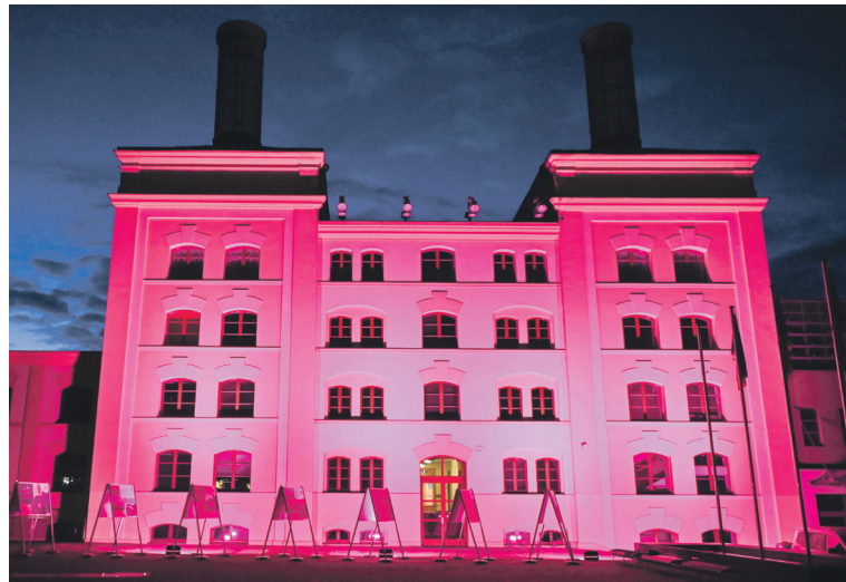
Krajský úřad se 1. října rozsvítil růžově, a připojil se tak k osvětové kampani Růžový říjen s Loono na podporu prevence rakoviny prsu. Ta upozorňuje na možnost samovyšetření prsu, které mohou pravidelně provádět všechny ženy z pohodlí domova s aplikací Preventivka nebo podle návodu na webu www.loono.cz .